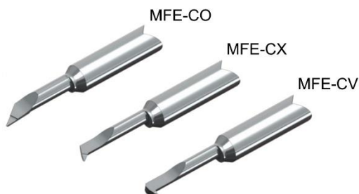
Neue Schneideinsätze des Systems MINIFIX: MFE-CO, MFE-CX und MFE-CV

Alle Informationen zu diesen Werkzeugen sowie eine übersichtliche Werkzeugauswahl mittels Such- und Filterfunktionen stehen online auf der Webseite der Firma Dieterle zur Verfügung. Angebote für die ausgewählten Werkzeuge können ganz bequem direkt online angefragt werden.